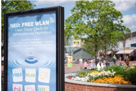
Hinweis auf den neuen Service am Tibarg

ment, zusätzlicher Straßenreinigung und einem zusätzlichen Winterräumdienst – sowie einem umfangreichen Standortmarketing konzentrieren. Beim Standortmarketing möchte der BID Tibarg II neue Wege gehen und die zunehmende Digitalisierung als Chance für den Tibarg nutzen. Die Entwicklung einer umfassenden Marketing- und Verkaufsplattform für den stationären Handel sowie die lokale Gastronomie und Dienstleistungsbranche – mit bspw. digitaler Verfügbarkeitsanzeige von Produkten, Reservierung von Produkten zur Abholung, digitalem Lageplan inkl. Navigation, digitalem Parkplatz- und Terminservice – soll hierbei das Ziel sein.