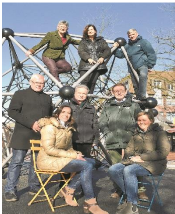
Lenkungsgruppe und Quartiersmanagement vom BID Tibarg